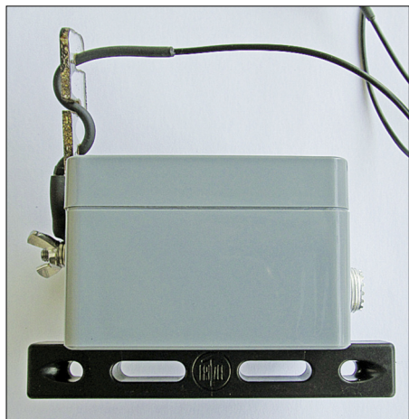
Bild 1: Unun-Kästchen; links Antennenanschluss mit Zugentlastung, unten Fritzel-Antennenisolator für die Befestigung, rechts Anschluss für das Antennenkabel

Will man das Gehäuse an einer Mauer befestigen, empfiehlt es sich, an dieser eine Holzlatte festzudübeln und daran das Ge-